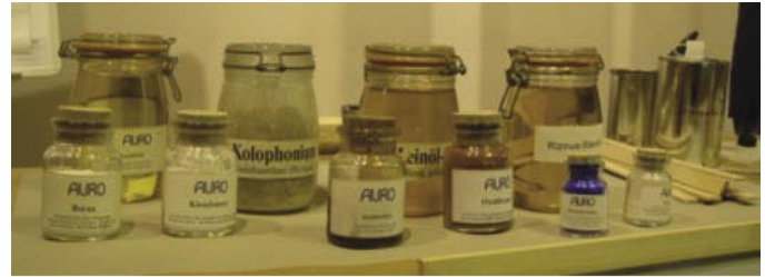
Aus natürlichen Rohstoffen entstehen hochwertige Produkte.

Übrigens AURO erfüllt als erster Farbenhersteller die neue EU-Verordnung für lösungsmittelfreien Oberflächenbehandlungsmittel, die mit Beginn 2007 in Kraft tritt.